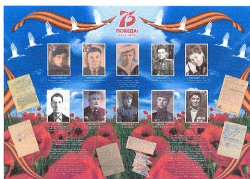
Бессмертный полк 3а класса

Ставшее международным общественное гражданско-патриотическое движение по сохранению личной памяти о поколении Великой Отечественной войны. Участники ежегодно в День Победы проходят колонной по улицам городов с фотографиями своих родственников — ветеранов армии и флота, партизан, подпольщиков, бойцов Сопротивления, тружеников тыла, узников концлагерей, блокадников, детей войны. Первая акция была организована 9 мая 2012г. в г. Томске. В 2019г. в ней приняли участие 80 стран мира. В 75-летие Великой Победы в связи с особой эпидемиологической обстановкой Бессмертный полк планеты пройдёт в режиме онлайн. Присоединяемся к маршу и мы.