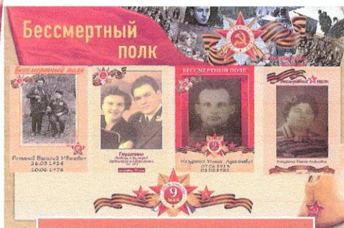
Бессмертный полк 11б