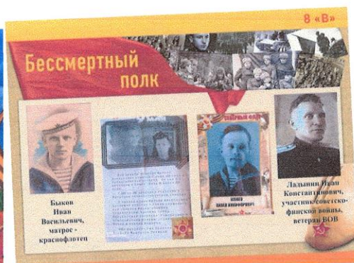
Бессмертный полк 8в класса