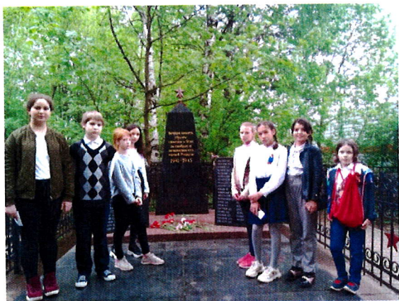
Учащиеся 5 б класса возложили цветы к Братской могиле

9б поздравил с праздником тружеников тыла и ветеранов Великой Отечественной войны .