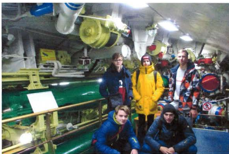
Мы в носовом торпедном отсеке. Сзади нас торпедные аппараты и макеты торпед

Оказалось, что торпедные аппараты предназначались не только для выпуска торпед, но и для покидания через них членов экипажа в случае затопления подводной лодки. Представьте, в трубу диаметром 53 см необходимо было вползти в специальном спасательном костюме, причем головой вперед и с прижатыми к телу руками. Затем дожидаться пока торпедный аппарат будет заполнен водой и в крошечной темноте, отталкиваясь ногами от стенок трубы, продвигаться к выходу, чтобы вынырнуть на поверхность. К сожалению, не с любой глубины, а с глубины около 50-60 метров. Внимательно выслушав рассказ экскурсовода, нам стали понятны трудности, возникшие перед героем фильма «72 метра».