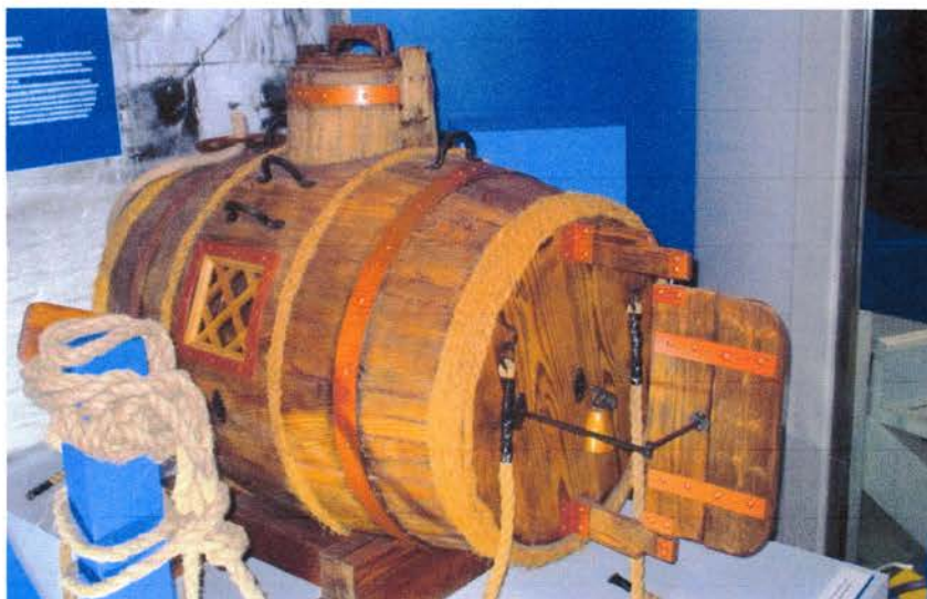
макет "потаённого судна" Ефима Никонова (1724 год), прообраза первой русской подводной лодки

Выставка была посвящена подводным силам советского и российского ВМФ. Мы увидели макет первого «потаённого судна» – можно сказать прототипа первой подводной лодки в мире.